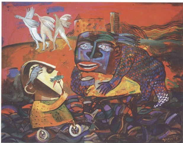
Veränderung, öl auf leinwand, 120 x 90 Change, oil on canvas, 120 x 90