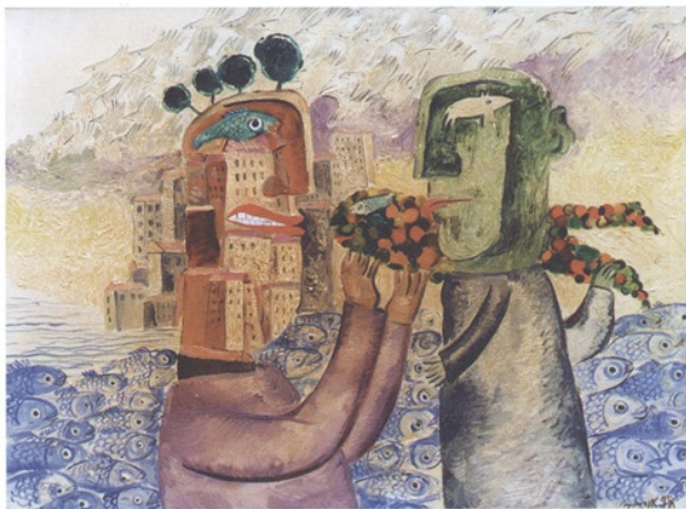
Gespräch, Öl auf leinwand, 110 x 80 Talk, oil on canvas, 110 x 80