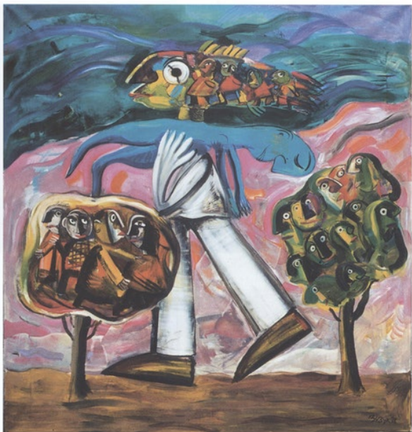
Metamorphose, öl auf leinwand, 180 x 200 Metamorphoses, oil on canvas, 180 x 200