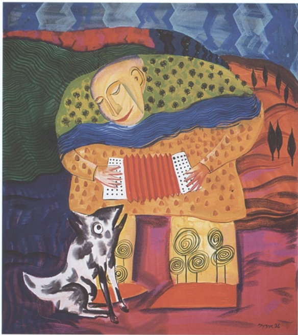
Der Harmoniker, öl auf leinwand, 115x 130