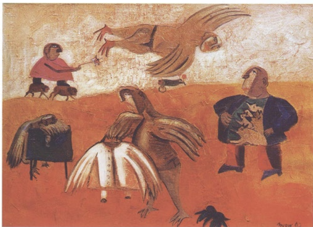
Einfaches Leben, öl auf leinwand, 120 x 90 Ordinary Life, oil on canvas, 120 x 90