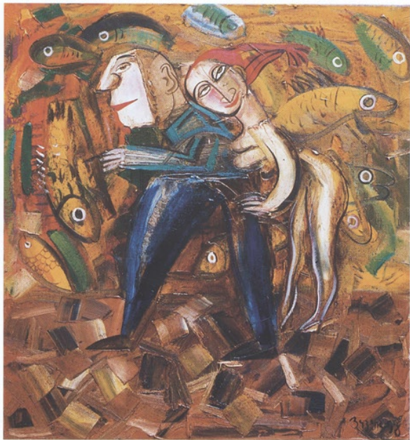
Idylle, Öl auf leinwand, 85 x 95