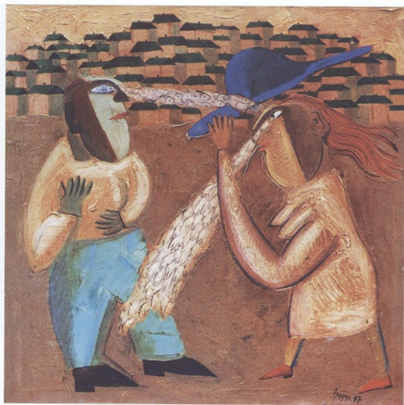
Blickkontakt, Öl auf Leinwand, 90 x 90 Eye Contact, oil on canvas, 90 x 90