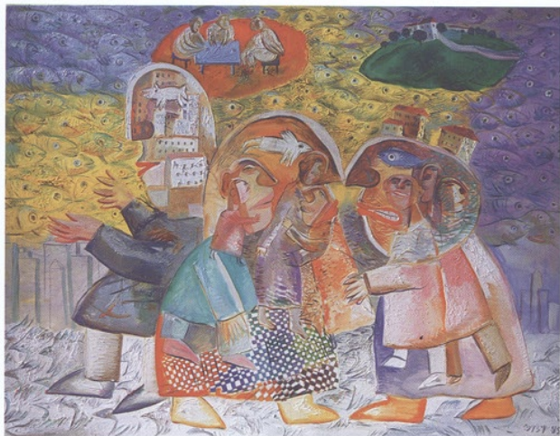
Auseinandersetzung, öl auf leinwand, 150 x 130