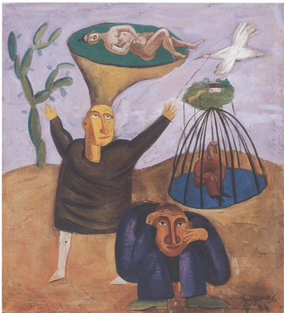
Drei verschiedene Schickgüle, öl auf leinwand, 130 x 150 Three different fates, oil on canvas, 130 x 150