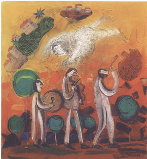
Musikanten, öl auf leinwand, 90 x 120