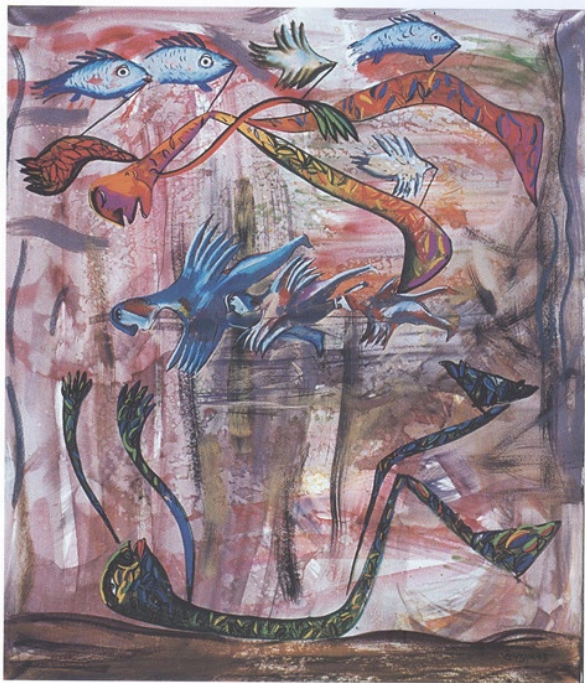
die Verabschiedung, akvarell, 120 x 140