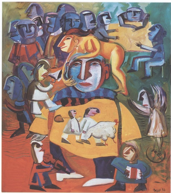
Beschäftigtes Leben, öl auf leinwand, 160 x 180 Busy Life, oil on canvas, 160 x 180