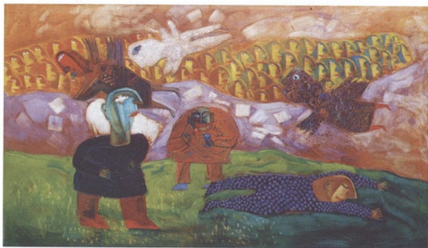
Traum, öl auf leinwand, 320 x 180 Dream, oil on canvas, 320 x 180