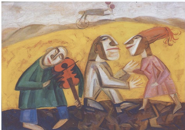
Tanz, öl auf leinwand, 120 x 90 Dance, oil on canvas, 120 x 90