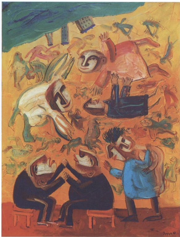
Schwierige Zeiten, Öl auf Leinwand, 90 x 140 Complicated Times, oil on canvas, 90 x 140