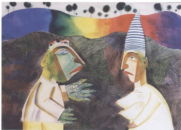
Begegnung, aquarell, 80 x 60

Encounter, water colour on paper, 80 x 60