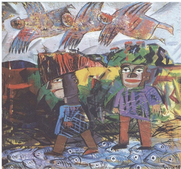
Drei Engel, öl auf leinwand, 85 x 85 Three Angels, oil on canvas, 85 x 85