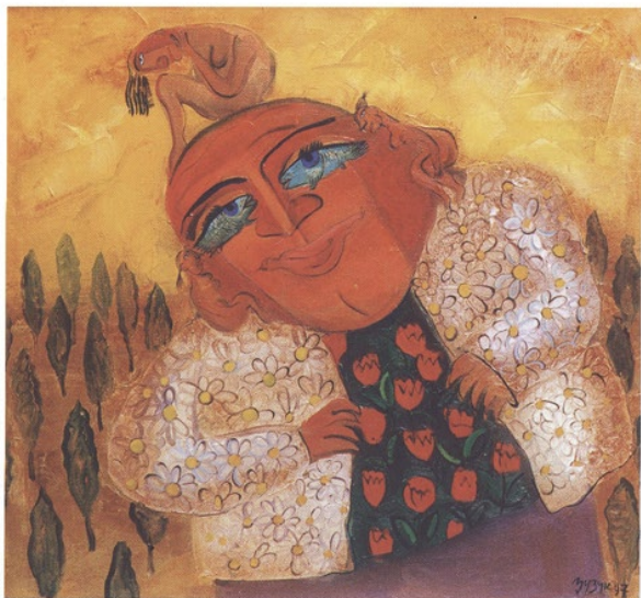
Südländer, öl auf leinwand, 95 x 85 Southerner, oil on canvas, 95 x 85