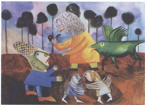
Morgenspaziergang, aquarell, 80 x 60

Morning Walk, water colour on paper, 80 x 60