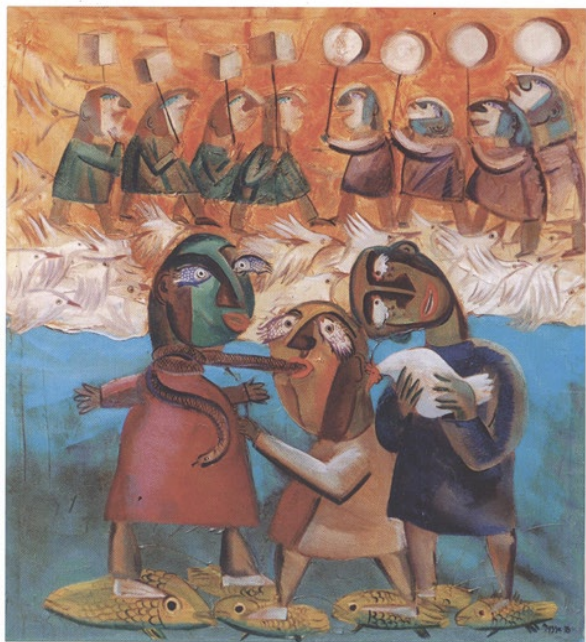
Parade II., öl auf leinwand, 130 x 140