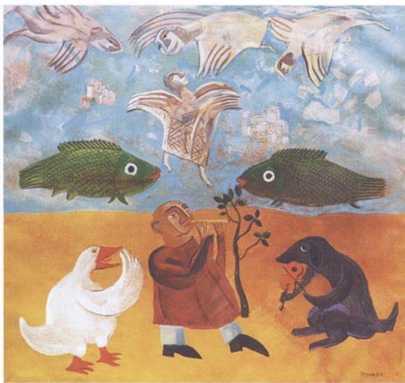
Harmonie, öl auf leinwand, 130 x 130