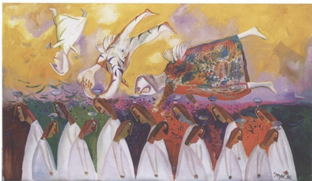
Himmliche Spaziergänger, öl auf leinwand, 320 x 180 Heavenly Walkers, oil on canvas, 320 x 180