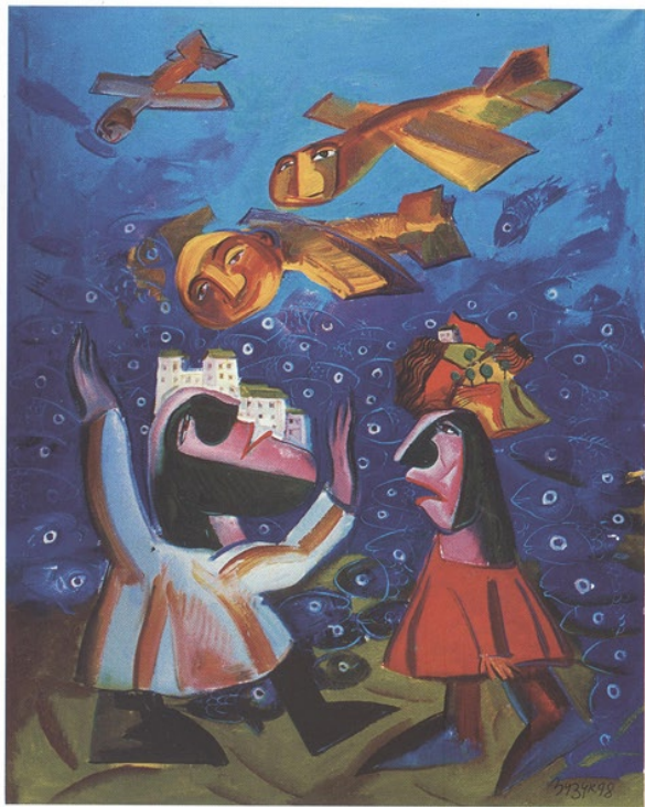
der Flug der Gedanken, öl auf leinwand, 120 x 180 the flight of thoughts, oil on canvas, 120 x 180