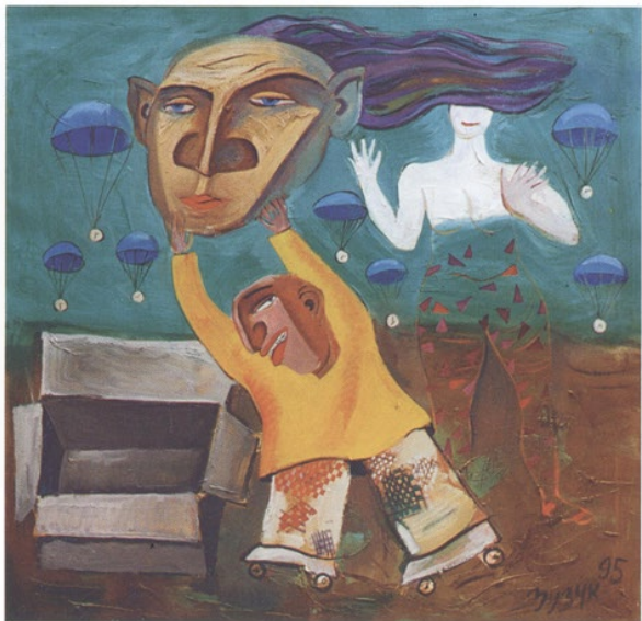
Ende der Gefühle, Öl auf Leinwand, 80 x 80