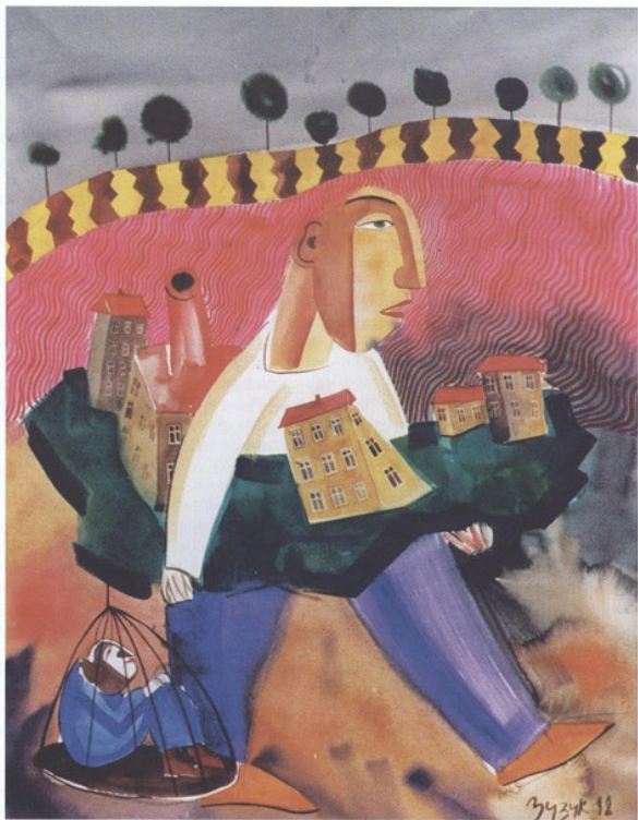
Emigrant, water colour on paper, 40 x 50